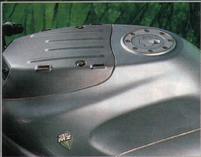
In den Tank sind Halterungen für ein von MuZ patentiertes Gepäcksystem integriert