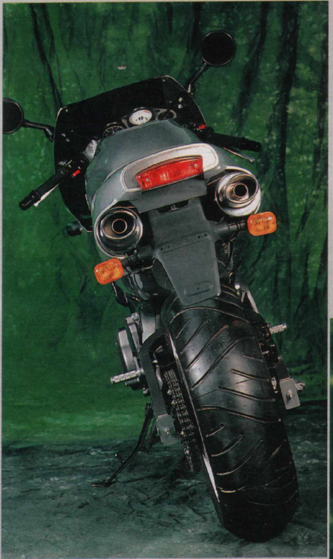
Die beiden Schalldämpfer stehen weder der Aerodynamik noch der Bodenfreiheit im Weg