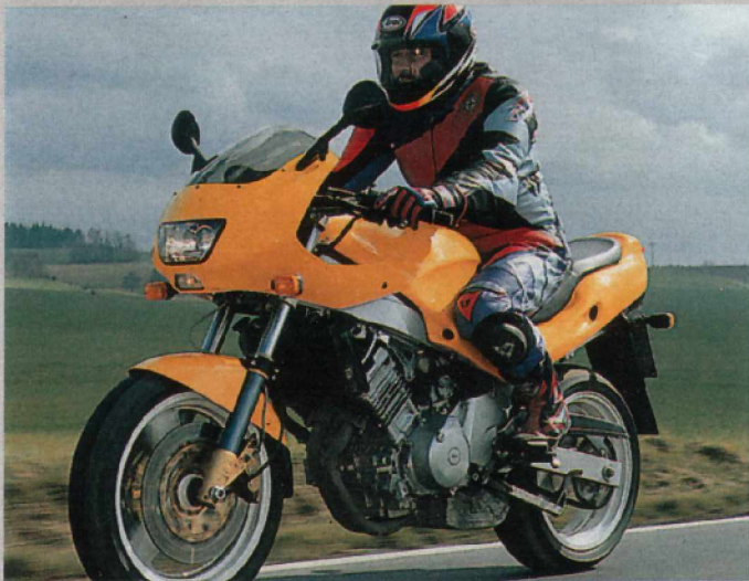
Neutral und zielgenau: Am Fahrwerk des Prototyps gibt es bis auf die Gabel und Sitzposition wenig auszusetzen